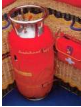
Gastank und Instrumente

Vorratsbehälter für den Treibstoff bestehen aus Edelstahl und sind gegen Stoß gepolstert.