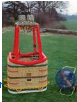
Korb und Brenner